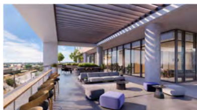
▲ 10 階 共用屋外テラス

共用施設として、アメニティフロアを 10 階と 20 階に設け、エリア最大規模の屋外テラス、ポスト・コロナのテナントトレンドを捉えたコワーキングスペースや共用会議室の他、ジムやスパ、プール及びゴルフシミュレーターといった充実した共用アメニティが計画されています。