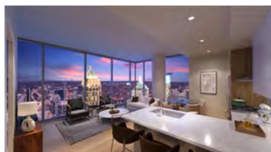
▲ 高層階住戸からの眺望