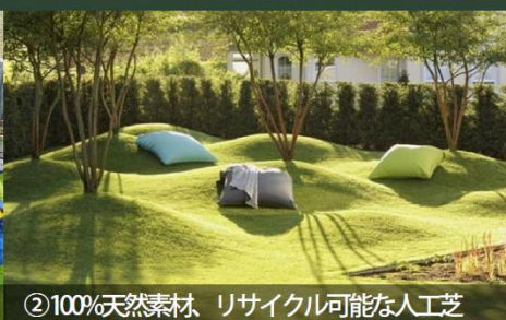
② 100%天然素材、リサイクル可能な人工芝