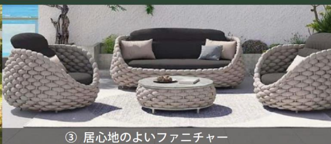
③ 居心地のよいファニチャー