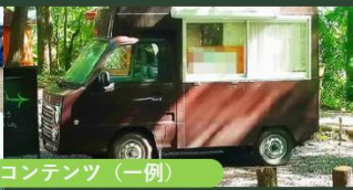
⑧ マルシェ（キッチンカー等）

※フルート演奏（11/5~11/6）、マルシェ（11/3~11/4）、幼児用自転車の体験スペース（11/3・5・6） その他コンテンツもご用意しております