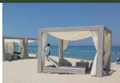
⑤ プライベートスペース