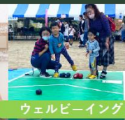
ウェルビーイングコンテンツ（一例）