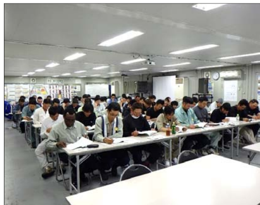
足場の組立て等作業従事者特別教育