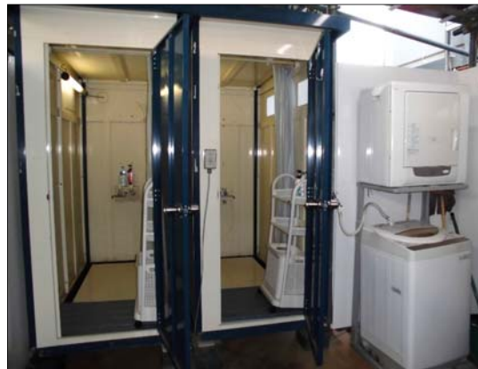
シャワー室・洗濯機・乾燥機