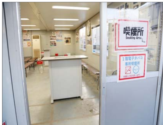
喫煙所(受動喫煙の防止)に煙吸引機設置