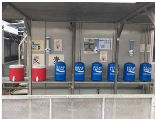
熱中症予防(水分補給・塩飴)