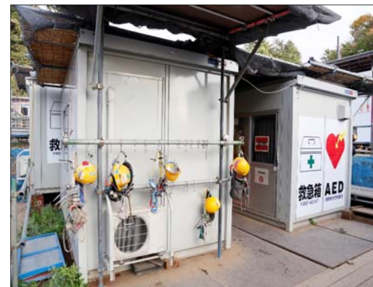
スポット休憩所 ※各所にAED・救急箱等設置