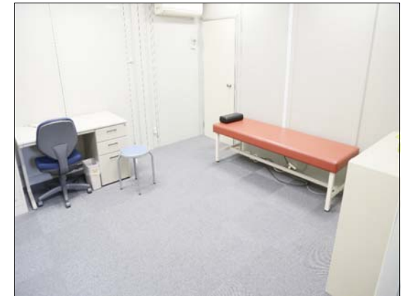
健康相談室 (医師等による健康相談)