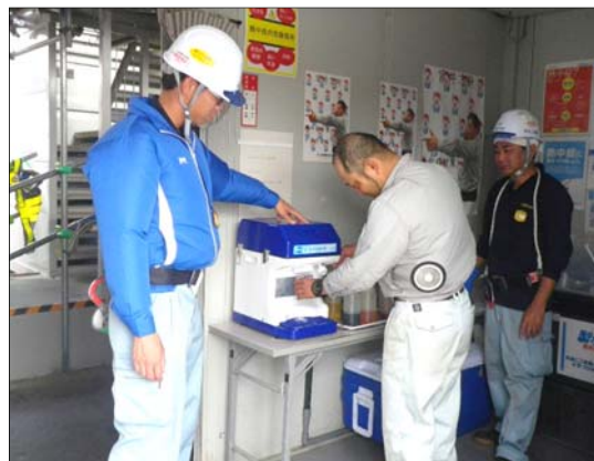
熱中症予防(かき氷機・製氷機)