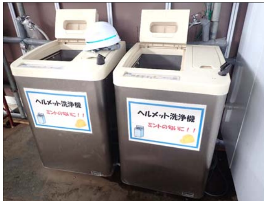
ヘルメット専用洗浄機