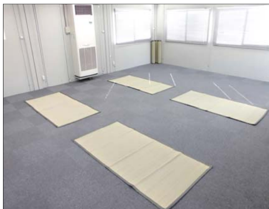
ストレッチや足を伸ばせる休憩所