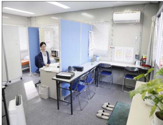
健康相談室 (受付、問診票・ストレスチェック等の記入場所)