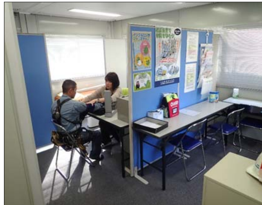
健康相談室 (看護師による血圧測定など健康状態の確認)