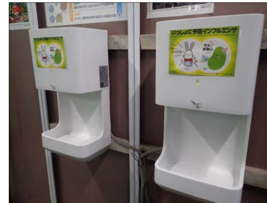
各所にハンドドライヤー