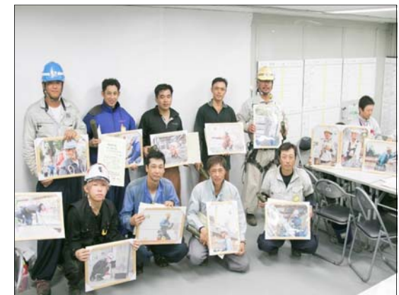
「働く姿の写真」を進呈