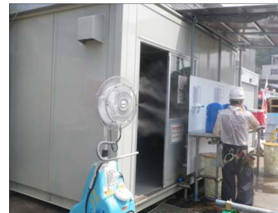
熱中症予防(冷房室・ミストファン)