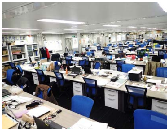
現場責任者等が使用する職長室 ※土足厳禁