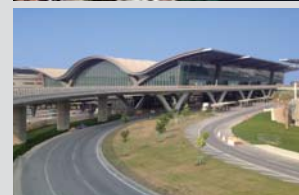
上より 鹿鳴館、帝国ホテル新館 ポスボラス海峡横断鉄道トンネル 新ドーハ国際空港