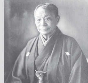
大倉喜八郎 1837(天保8) - 1928(昭和3)

1873年、近代日本の幕開けと共に新たな国づくりを担うべく創業し、「建設」を通じ様々な時代の要請に応えてきた大成建設。その140年の歩みと、これからも「未来」をつくり続ける取り組みをご覧ください。