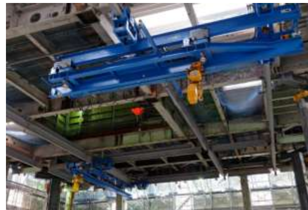
□天井走行クレーン/発電テルハ