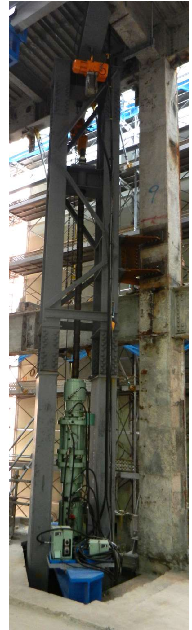
□ジャッキダウンシステム