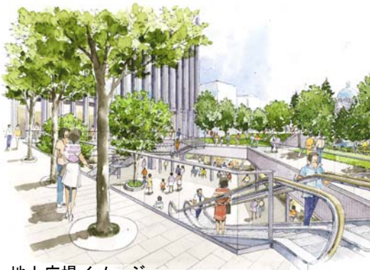
地上広場イメージ