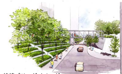
接続ブリッジイメージ