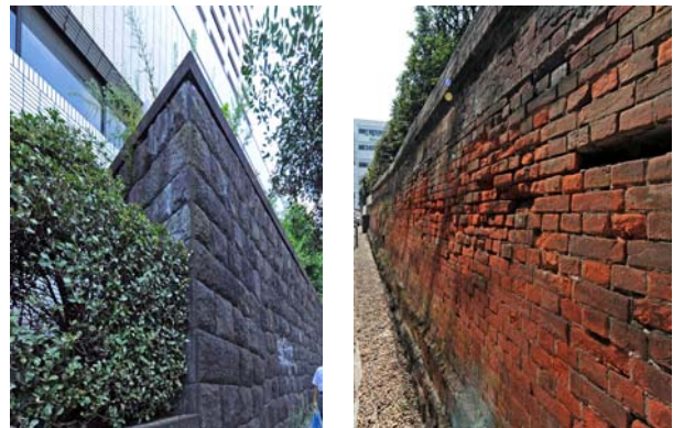
計画地で保存・再利用する石垣、レンガ