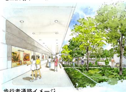
歩行者通路イメージ