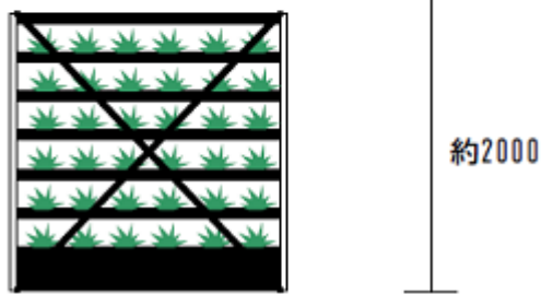
【栽培ユニット参考】