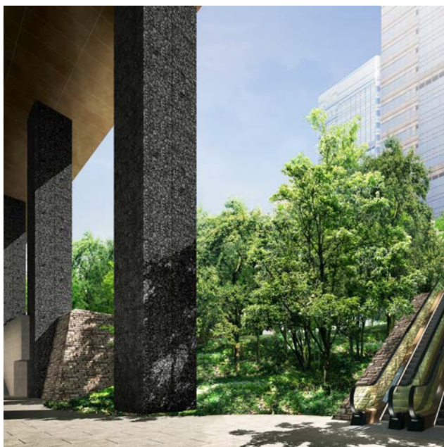
大手町タワーより「大手町の森」を望む（CG）