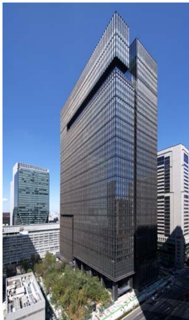
大手町タワー外観

ここでは、そのコンセプトやプロセス、期待される効果などについて改めてご紹介いたします。