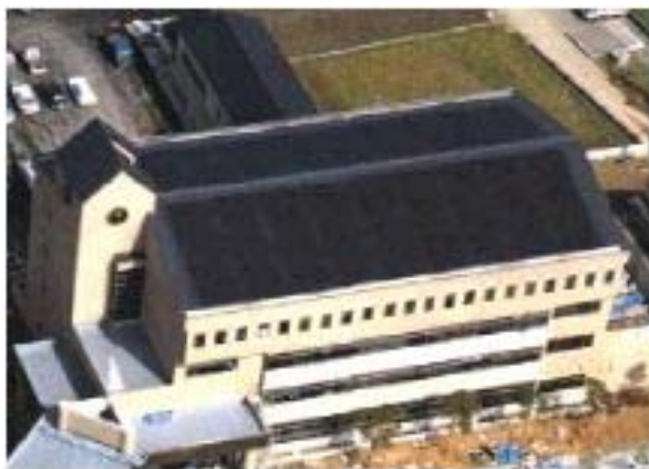
■屋根材一体型太陽電池