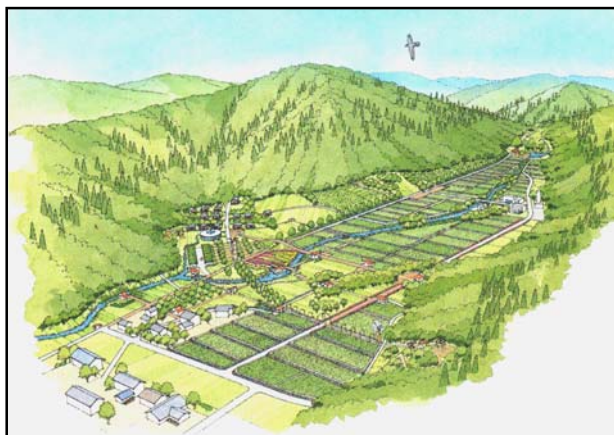
■K村ケーススタディ（中山間型エコビレッジ）

日本の典型的な谷戸風景を残す地域で、グリーンツーリズムを軸とした施設計画を行い、施設の配置にあたっては、古くから地域で培われてきた自然・人為環境を尊重し、ランドスケープに配慮した施設の計画をしています。