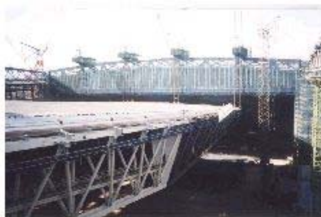
■さいたまアリーナ