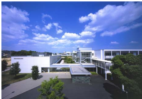
■東海大学附属第二高等学校