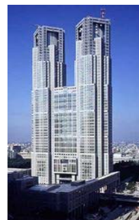
東京都第一本庁舎