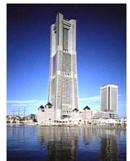
横浜ランドマークタワー