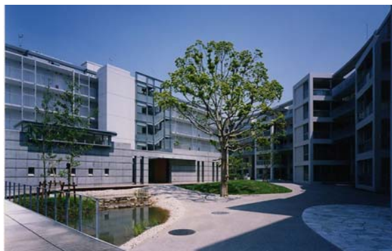
■エコビレッジ松戸