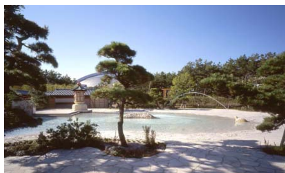
■フェニックスシーガイア「松泉宮」