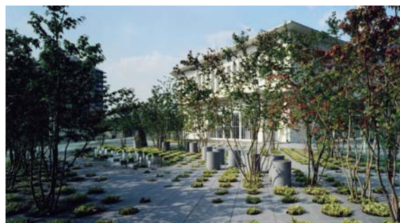
■慶應義塾大学三田キャンパス南館