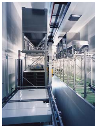
■ 杏林製薬(株)能代工場