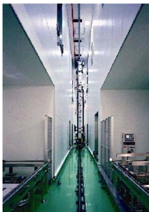
■ 明治製菓(株)小田原工場