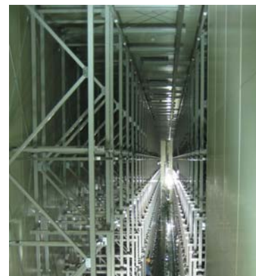
■ 塩野義製薬(株)摂津工場