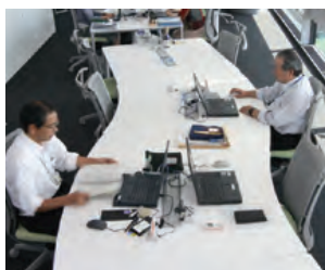
当社東北支店 テナントビルの中に社をイメージした フォレストオフィス