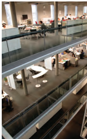
大成札幌ビル BCP(事業継続)から環境問題・ワーク プレイスまで考えた新築ビル