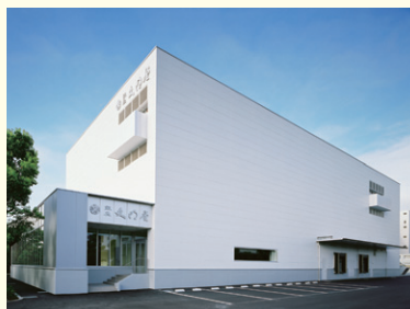
文明堂製菓(株)船橋工場