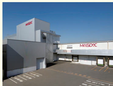
(株)マスダック食品新工場