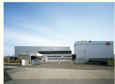
森永乳業(株)神戸工場