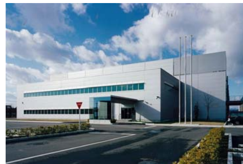
■先端技術研究施設