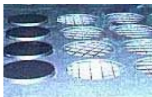
■CVスラブ (穴明きプラスチックコンクリートスラブ)