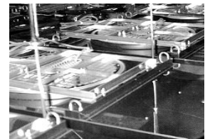
■ファンフィルタ ユニット(FFU)

○アウトガス制御が必要な場合には、使用目的に最適なアウトガス対策品でお応えします。