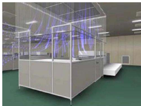
局所クリーン化方式