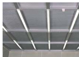
■天井フレーム 組込形照明